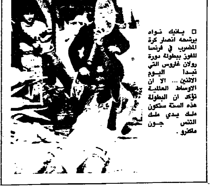
يملكه نواو يرشحه انصار كرة الضرب في فرنسا للقاء بطولة دورة اوساط العائلية